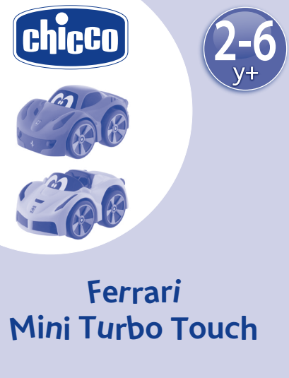
F12 TDF (Tour de France) 000094940000000 LA FERRARI APERTA 000094950000000