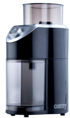
Burr Coffe Grinder CR 4439