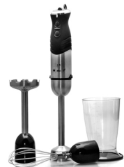
Hand blender CR 4612