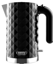
Electric Kettle CR 1269