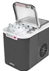
Ice Cube Maker CR 8073