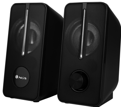
GSX-150 2.0 GAMING SPEAKER WITH RGB LIGHTS