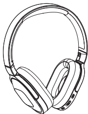
Cuffie Bluetooth Philips TAH6506