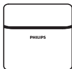
Custodia per il trasporto