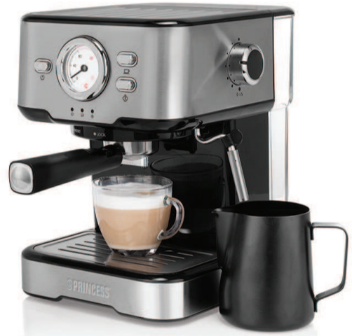
Espresso Machine 01.249412.01.001

PARTS DESCRIPTION / ONDERDELENBESCHRIJVING / DESCRIPTION DES PIÈCES / TEILBESCHREIBUNG / DESCRIPCIÓN DE LAS PIEZAS / DESCRIÇÃO DOS COMPONENTES / DESCRIZIONE DELLE PARTI / BESKRIVNING AV DELAR / OPIS CZĘŚCI / POPIS SUČASTI / ОПИСАНИЕ ЗАРЯЖАЧА