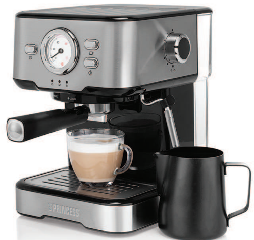
Espresso Machine 01.249412.01.001

PARTS DESCRIPTION / ONDERDELENBESCHRIJVING / DESCRIPTION DES PIÈCES / TEILEBESCHREIBUNG / DESCRIPCIÓN DE LAS PIEZAS / DESCRIÇÃO DOS COMPONENTES / DESCRIZIONE DELLE PARTI / BESKRIVNING AV DELAR / OPIS CZĘŚCI / POPIS SOUČÁSTI / POPIS SUČASTI / ОПИСАНИЕ ЗАПЧАСТИ