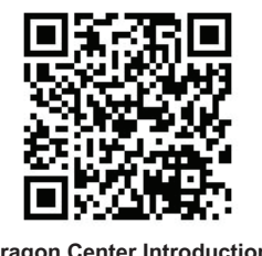
Dragon Center Introduction