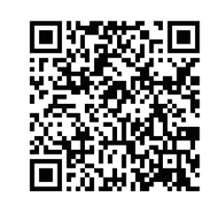
Installation Guide (AMD)