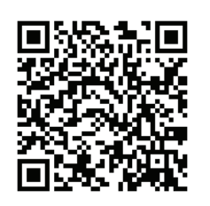
Installation Guide (NVIDIA)