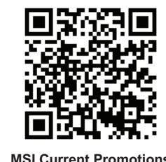
MSI Current Promotions