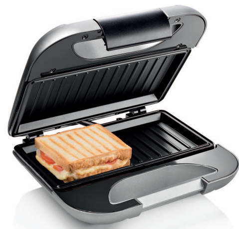
Sandwich Maker DeLuxe 01.127003.01.001

PARTS DESCRIPTION / ONDERDELENBESCHRIJVING / DESCRIPTION DES PIÈCES / TEILEBESCHREIBUNG / DESCRIPCIÓN DE LAS PIEZAS / DESCRIÇÃO DOS COMPONENTES / DESCRIZIONE DELLE PARTI / BESKRIVNING AV DELAR / OPIS CZĘŚCI / POPIS SOUČÁSTÍ / POPIS SUČASTI / ОПИСАНИЕ ЗАПЧАСТИ