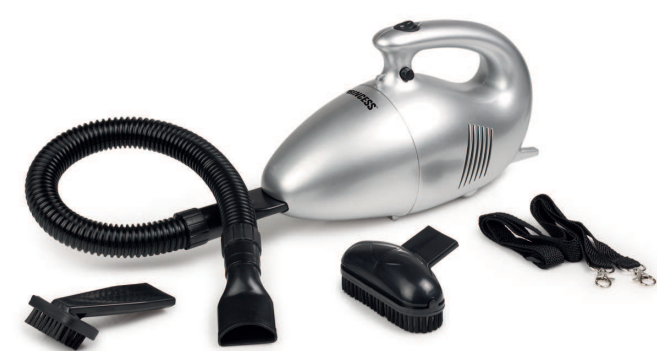
Turbo Tiger Compact Vacuum Cleaner 01.332757.01.001

PARTS DESCRIPTION / ONDERDELENBESCHRIJVING / DESCRIPTION DES PIÈCES / TEILEBESCHREIBUNG / DESCRIPCIÓN DE LAS PIEZAS / DESCRIÇÃO DOS COMPONENTES / DESCRIZIONE DELLE PARTI / BESKRIVNING AV DELAR / OPIS CZĘŚCI / POPIS SOUČÁSTÍ / POPIS SUČASTÍ / ОПИСАНИЕ ЗАПЧАСТИ