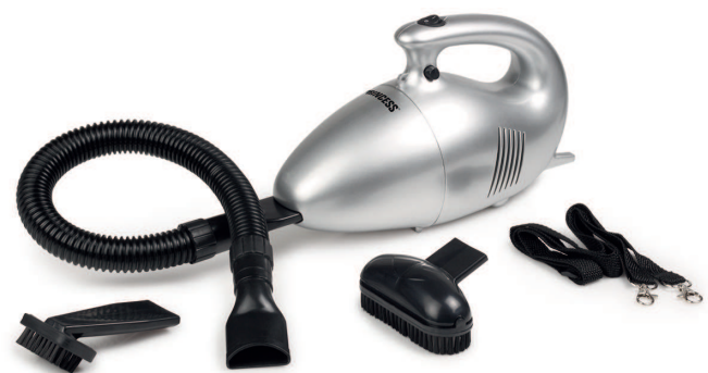
Turbo Tiger Compact Vacuum Cleaner 01.332757.01.001

PARTS DESCRIPTION / ONDERDELENBESCHRIJVING / DESCRIPTION DES PIÈCES / TEILEBESCHREIBUNG / DESCRIPCIÓN DE LAS PIEZAS / DESCRIÇÃO DOS COMPONENTES / DESCRIZIONE DELLE PARTI / BESKRIVNING AV DELAR / OPIS CZĘŚCI / POPIS SOUČÁSTÍ / POPIS SÚČASTÍ / ОПИСАНИЕ ЗАПЧАСТІ