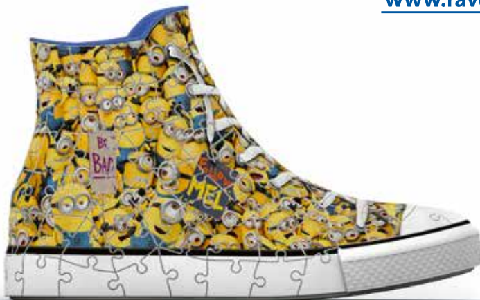
Sneaker - Despicable Me 3 - No. 12 262 3