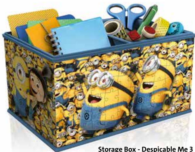
Storage Box - Despicable Me 3 No. 12 260 9