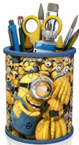
Pencil Holder - Despicable Me 3 No. 12 261 6

Ⓓ Dies ist ein internationaler Prospekt. Es ist daher möglich, dass nicht alle Produkte in Ihrem Land erhältlich sind. ⒸⒺ ⒺⒶ Some products shown in this international brochure may not be available in your country. Ⓕ Ce dépliant est international. Il est donc probable que tous les motifs ne soient pas disponibles dans votre pays. Ⓖ Questo è un catalogo internazionale, è quindi possibile che alcuni soggetti non siano disponibili nel vostro paese. Ⓗ Este es un catálogo internacional. Por eso es posible que algunos modelos no estén a la venta en su país. ⒼⒹ Dit is een internationale folder. Het is dus mogelijk dat niet alle motieven in uw land verkrijgbaar zijn.