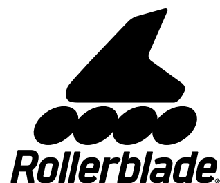
TABELLA TAGLIE MICROBLADE