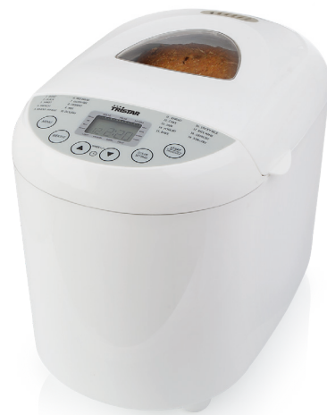
TRISTAR EKMEK YAPMA MAKİNESİ MODEL: BM-4586