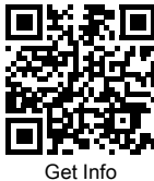
Zebra Technologies | 3 Overlook Point | Lincolnshire, IL 60069 USA www.zebra.com

©2018 ZIH Corp e/o affiliato. Tutti i diritti riservati. ZEBRA e il logo della testa di zebra stilizzata sono marchi di ZIH Corp., registrati in molte giurisdizioni in tutto il mondo. Tutti gli altri marchi appartengono ai rispettivi proprietari.